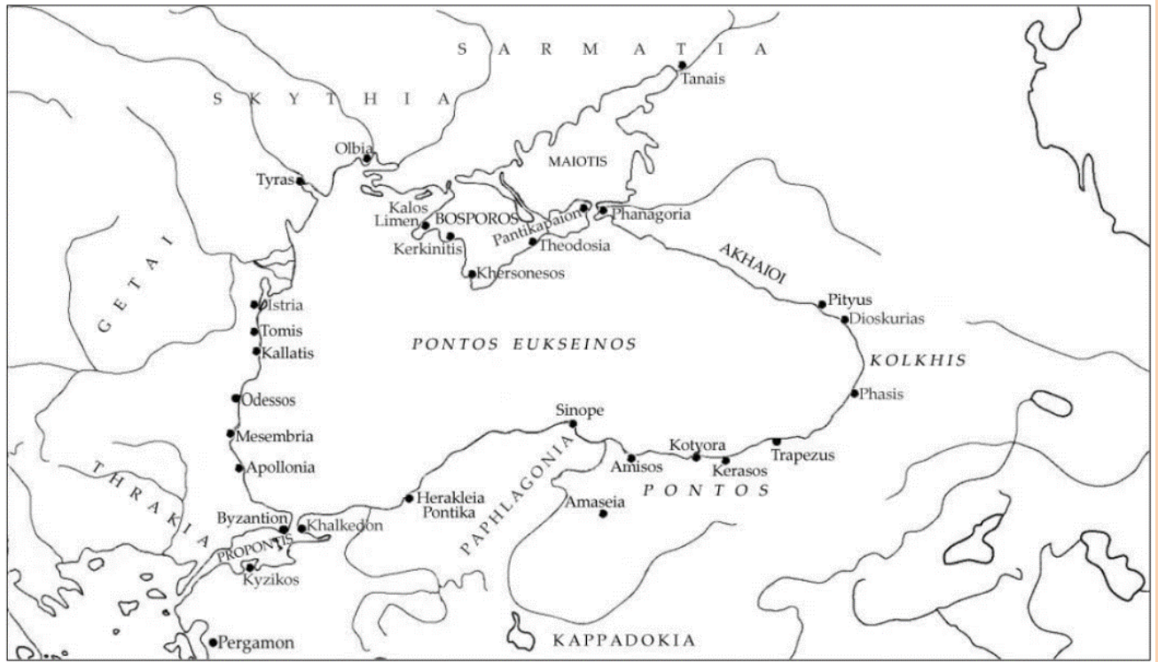
Harita 2: Karadeniz'de Kolonizasyon Hareketleri (Arslan 2006, Fig. 1)