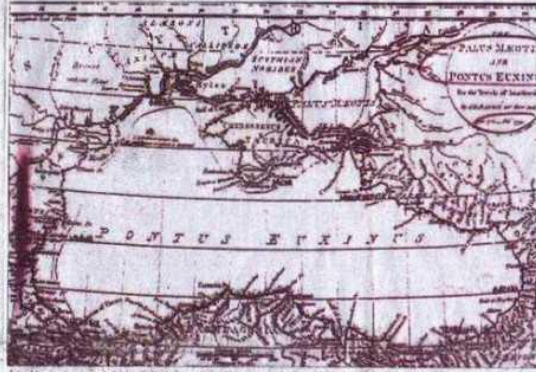
İşte Venizelos gemisinde dağıtılan harita. "Karadeniz" tüm dünyada "Black Sea", "Schwarz Meer" diye bilinir. Harita'da "Karadeniz" anlamına gelir. Patrik Efendi'nin haritasına bakarsak, orası "Pontus Gölü" imiş.

● Yetkililer, "Trabzon Limanı"ndan 20 Eylül'de başlatılan ve çevrecilerin dışında kalan unsurları ile gündeme gelen sempozyum için bütün yasal önlemlerin alındığını, taşıma ve fiili saldırı olmadığını, katılımcıların Sürmeli Manastırını gezdiklerini" belirtti. Bütün bu belgeler, ORTADOĞU'nun haberleri ile yazıları ile bir perçeme parmak başlığını ve "Papazlar"ın oyunu'nu su yüzüne çıkardığını ortaya koyuyor.