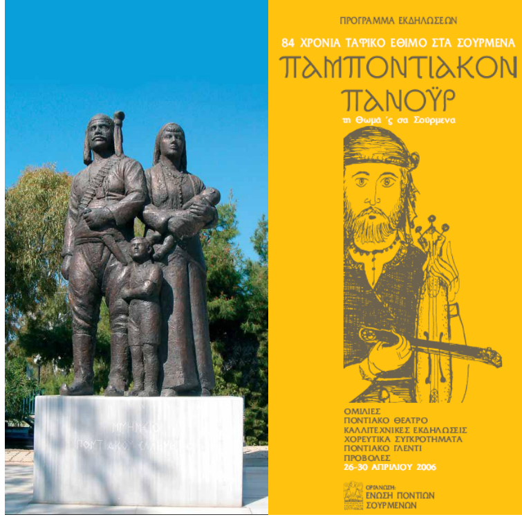
Solda: Yunanistan'da Rum/Pontus soykırım söylemlerini temsilen dikilen anıtlardan birisi. Sağda: Yunanistan'da konuyla ilgili olarak yayımlanan propaganda broşürlerinden birisi.

Selanik kentinde iki “soykırım” anıtı bulunmaktadır. Bunlardan biri Aya Sofya Meydanında, bir diğeri ise Selanik’in Kordelyu semtinde açılmıştır. İlk heykelde, kucığında çocuk taşıyan bir kadın resmedilmektedir. İkinci “Pontus Soykırım Anıtı”, 2006’da Türkiye Başbakanı’nın resmî bir ziyaretinin hemen ardından, Atatürk’ün evi ile aynı bahçeyi paylaşan Selanik Başkonsolosluğu’nun yanında bir yere dikildi. 19 Anıtın açılışını yapan Selanik Belediye Başkanı Vasilis Papayorgopoulos açılıştan bir ay sonra Selanik ile İzmir’in kardeş kent ilân edileceği tören için Türkiye’ye gelmişti. 20 Dolayısıyla Türkiye’yi hedef alan, Türklere karşı fobiye destekleyen eylemler Türkiye ile yaklaşma dönemlerinde de aynı hızla sürdürülmüştür.