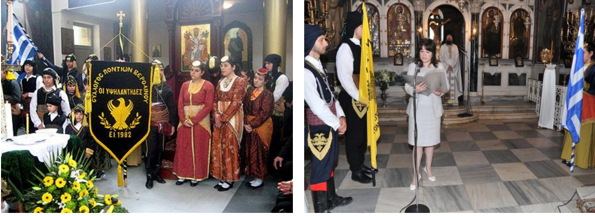
Resim 3: Sözde “Pontus Soykırımı” Anma Törenleri