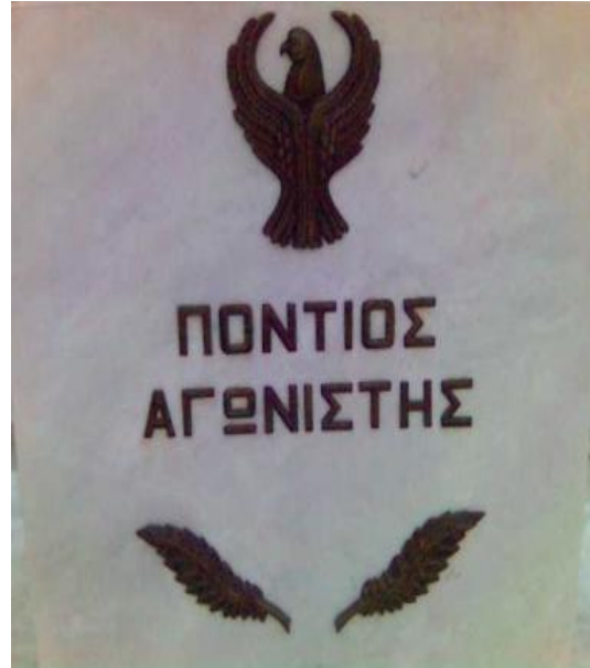
Resim 2: Propaganda Amaçlı Yapılmış bazı Sözde “Pontus Soykırımı” Anıtları

Pontus derneklerinin birçoğu son dönemlerde ortaya çıkmış olsa da çok daha eski dönemlerde de benzer dernekler kurulmuştur. Amerika Birleşik Devletleri ve Kanada’da, kuruluş tarihleri yirminci yüzyılın başlarına kadar giden dernekler olmuştur. New York’ta kurulmuş olan “ The Greek-American Pontus League ”, “ Diogenes Society ”, “ Galliana ”, “ The Renaissance ”, “ Komene ” ve “ Kapu-Kioi ” isimli dernekler ile Euxinopontus Dernekleri olarak