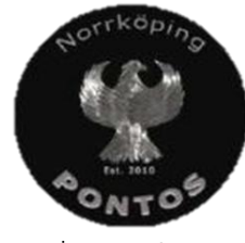
İsveç'te Bulunan "Pontos" isimli Pontus Kültübü