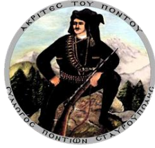
Akrites Pontus Derneği