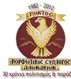
"Pontos" isimli Pontus Kültür Derneği