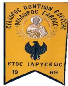
"Edessas" Pontus Derneği