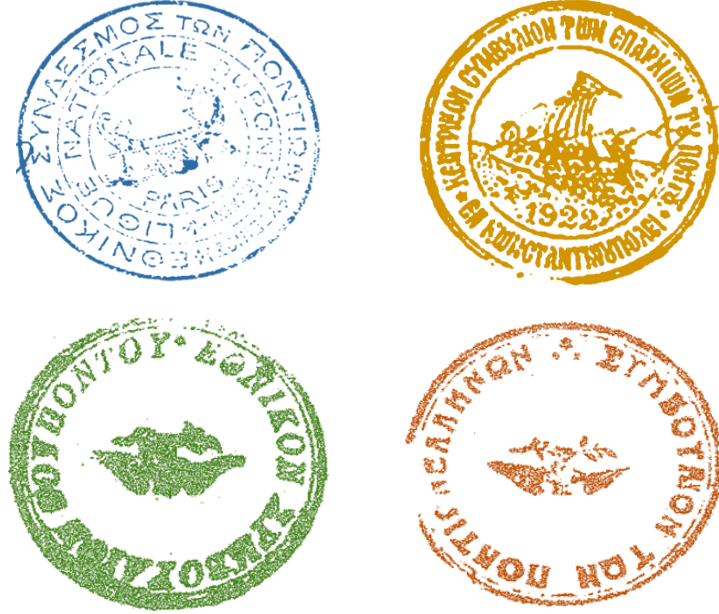
Resim 1: Pontus Teşkilatlarının Kullandığı Bazı Mühürler 48

İzci Teşkilatı , 45 Cemiyet-i Edebiye ve Pontus Rumları Komitesi , 46 Rum İttihâd-ı Millî Cemiyeti , Ahz-ı Asker Şubesi , Rum Ticaret Örgütü gibi İstanbul'da kurulan teşkilatların yanında Batum (Pontus Rumları Derneği, Pontus Ulusal Merkezi), Atina (Merkezî Pontus Komitesi), Paris (Pontus Millî Birliği), Marsilya (Pontus Komitesi) ve Krasnodar 47 (Pontus Millî Merkezi Heyeti) gibi merkezlerdeki teşkilatlar vasıtasıyla da Pontusçuların faaliyetleri desteklenmiştir.