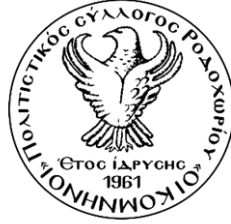
"Kommuni" isimli Pontus Kültür Derneği