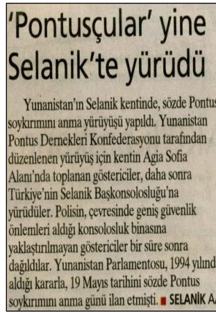
(Milliyet, 20 Mayıs 2007, s:24) Pontuşçu etkinliklerle ilgili bir haber