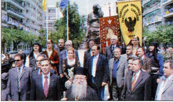
(Eleftepos Tipos, 19 Mayıs 2006, s:18)

edilmiştir. Bakanlık açıklaması, “Hiçbir dayanağı olmayan iddialara konu olan bu adımın Türkiye ile Yunanistan arasında geliştirmeye çalıştığımız işbirliği ve diyalog ruhuyla uyuşmadığı yönündeki görüşümüzü bu vesileyle bir kez daha yinelemek istiyoruz” sözleriyle sona erdirilmiştir. 70 Diğer taraftan Dışişleri Bakanı ve Başbakan Yardımcısı Abdullah Gül, konuyla ilgili olarak kendisine sorulan bir soruya da böyle bir anıt dikilmesinin Türkiye ile Yunanistan ilişkilerini gölgeleyeceğini söylemiştir. 71 Öte yandan bir ay sonra İzmir ile Selânik kentleri arasında imzalanması plânlanan kardeş şehir protokolü de İzmir Büyükşehir Belediyesi tarafından iptal edilmiştir. Yunanistan’daki Pontus Dernekleri Federasyonu Başkanı Yorgo Parharidis ise İzmir ve Selânik’in kardeş şehir ilân edilmesine dair protokolün iptalinden duyduğu üzüntüyü belirtmekle beraber, yine de “Pontus Helenizmi Soykırımı”nı Türkiye’nin tanıyarak özür dilemesini istemiştir. 72