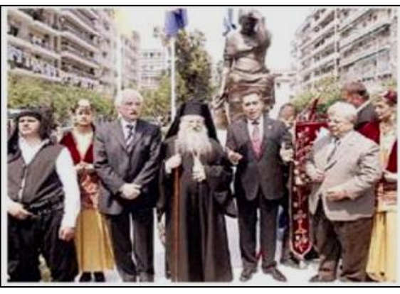
(Hürriyet, 8 Mayıs 2006 s:24) Selânik-Ayasofya Meydanı'nda açılan “Pontus Helenizmi Soykırımı” anıtının açılışı