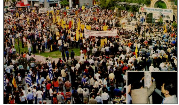
(Milliyet , 20 Mayıs 2006, s:14)

Selânik’te, “Pontoslular Soykırımı Anıtı” önünde yapılan tören