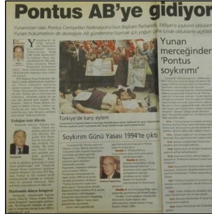
(Milliyet 17 Mayıs, 2006)