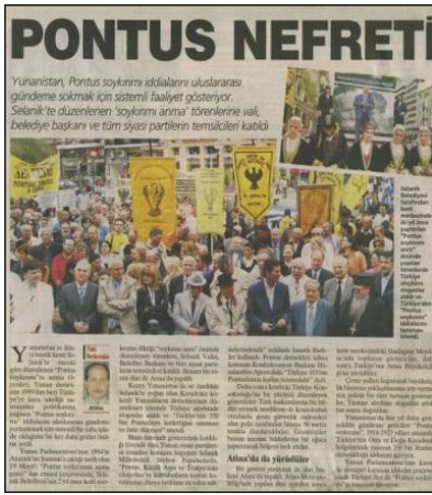
(Milliyet, 21 Mayıs 2007, s:14) 19 Mayıs 2007'de Selanik'te yapılan gösteriler

Yunanistan'da 16 Eylül 2007 seçimlerinden sonra Başbakan Karamanlis liderliğindeki hükümetin yeni Eğitim Bakanı ve Din İşleri Bakanı Evripidis Stilyanidis'in ilk icraatı da, Türkleri kötüleyen bir bakış açısıyla yazılmadığı için çeşitli çevrelerce eleştirilen ilköğretim 6. Sınıf tarih kitabını geri çekmek olmuştur. Bakan Stilyanidis 25 Eylül günü düzenlediği basın toplantısında, Pedagoji Enstitüsü'nün kitabın içeriğinin uygunluğu konusunda çekinceleri olduğunu belirterek, kitabın müfredattan kaldırıldığını söylemiştir. 93