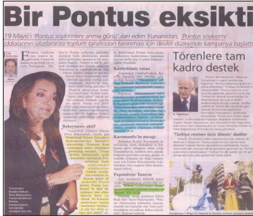
(Milliyet, 16 Mayıs 2006, s:13)

ilgili olarak Yunan Parlamentosu'nda alınan kararların değiştirilmediği sürece, Türkiye parlamentosunca alınan bir kararın ortadan kalkmasının mümkün olmadığı belirtilmiştir. 75