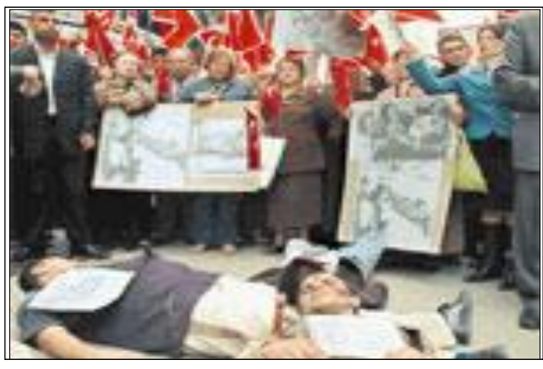
( http://www.milliyet.com.tr/2006/05/17/dunya/adun.html ) Yunanistan'ın İstanbul Başkonsolosluğu önünde toplanan bir grup, Selânik'teki “Pontus Soykırım Anıtı”nı protesto ederek Konsolosluğa siyah çelenk bıraktılar (14 Mayıs 2006)