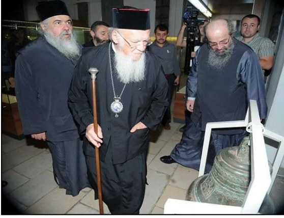
Fener Rum Patriği Bartholomeos beraberindeki Hristiyan din adamlarıyla , 1982 yılında restore edildikten sonra müze olarak ziyarete açılan Aya Nikola Kilisesi'ni (Giresun) ziyaretlerinde eserleri incelerken

( http://www.21yyte.org/tr/arastirma/teostrateji-arastirmalari-merkezi/2014/10/06/7788/rum-patrigi-bartholomeosun-dogu-karadeniz-gezisi )