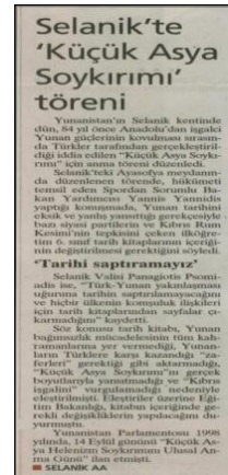
(Milliyet, 24 Eylül 2007, s:14) Yunanların, “Küçük Asya Helenizm Soykırımını Ulusal Anma Günü” etkinlikleriyle ilgili haber